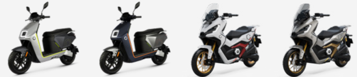
CECOTEC HALO (PLATA VERDE)