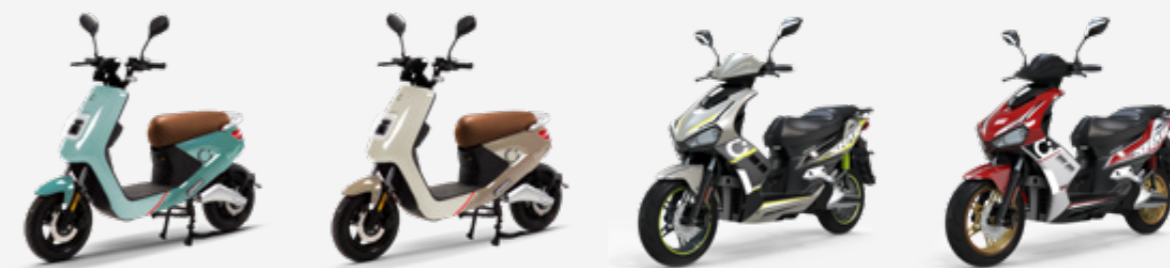
CECOTEC PIAZZA (AZUL)