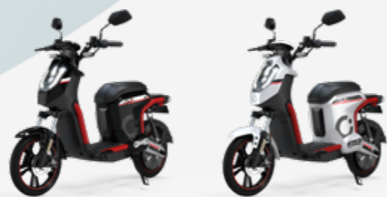
CECOTEC SKULL (NEGRO/ROJO)