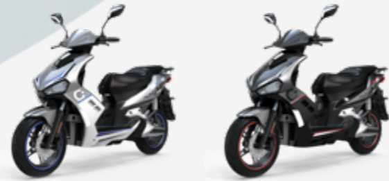
CECOTEC SHARK RS (PLATA/AZUL)